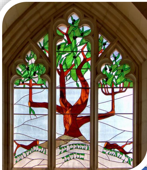
Glas-in-lood-raam Christ Church | Jeruzalem